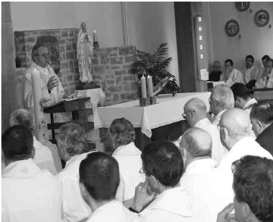
Nadbiskup Puljić predvodi misno slavlje u kapeli Sjemeništa "Zmajević" prigodom Svećeničke rekolacije