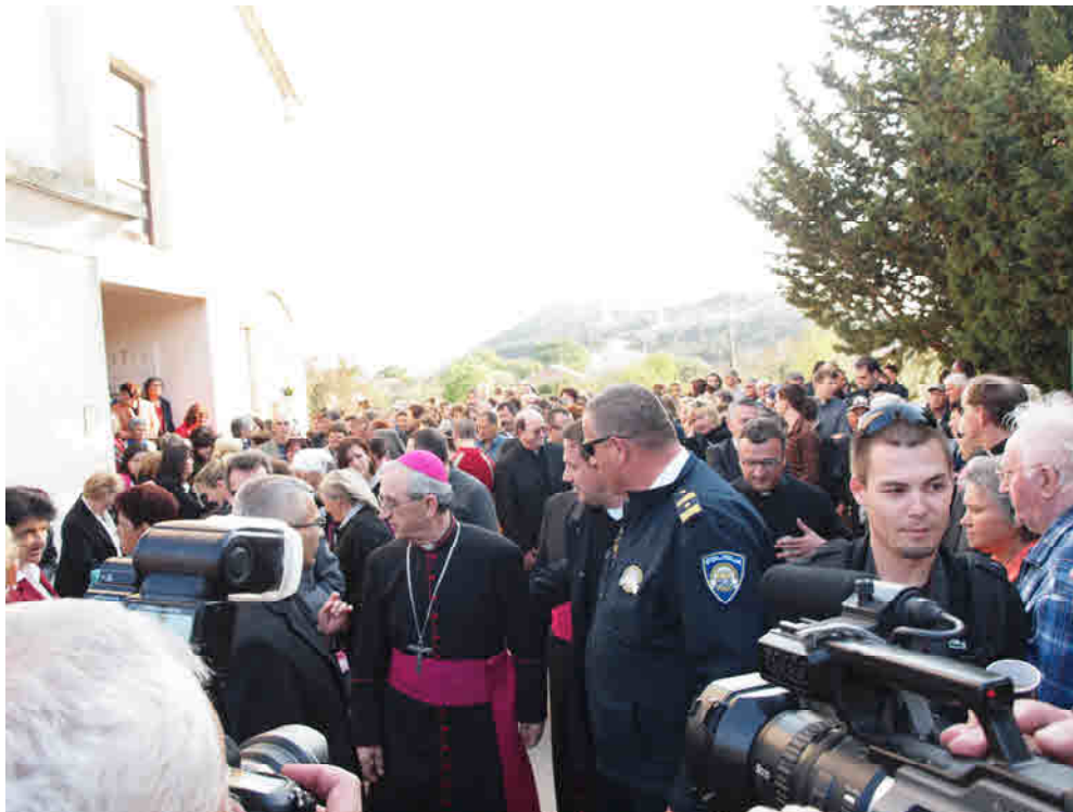
DOČEK IMENOVANOG ZADARSKOG NADBISKUPA ŽELIMIRA PULJIĆA U DRAGAMA