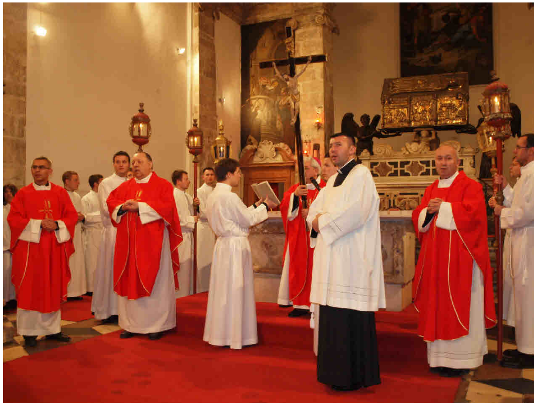
NUNCIJ CASSARI PREDVODIO SLUŽBU MUKE GOSPODNE U ZADRU