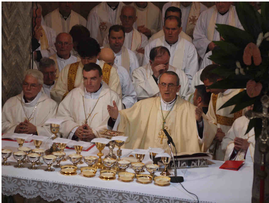
Svečana koncelebracija prigodom preuzimanja službe nadbiskupa Puljića