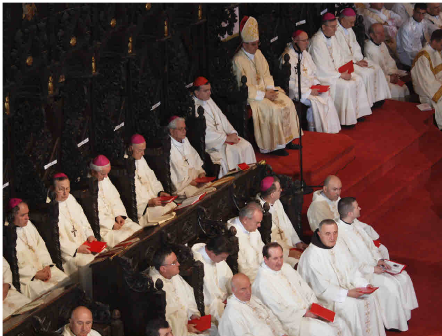
Tekstovi i fotografije: Ines Grbić