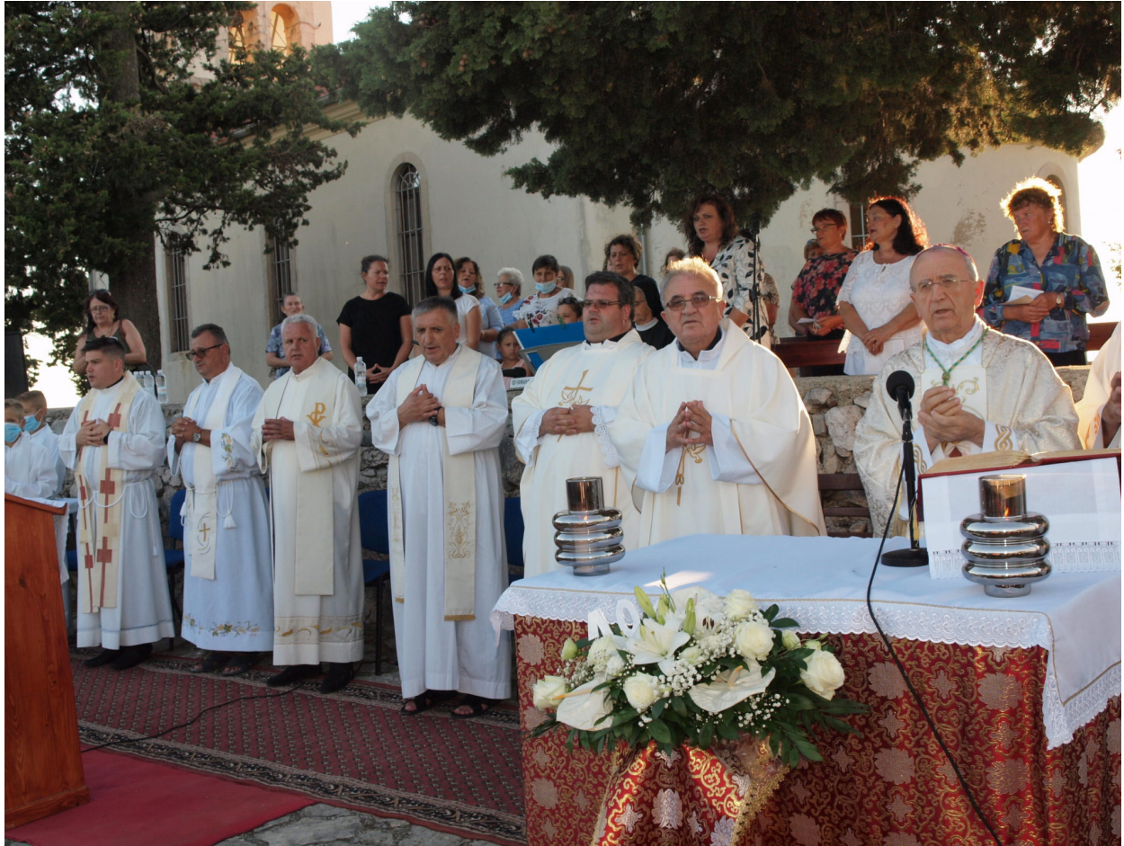
Blagdan Gospe Karmelske i stota godišnjica zavjetnog kipa Gospe Karmelske u Galovcu 16. srpnja 2020.